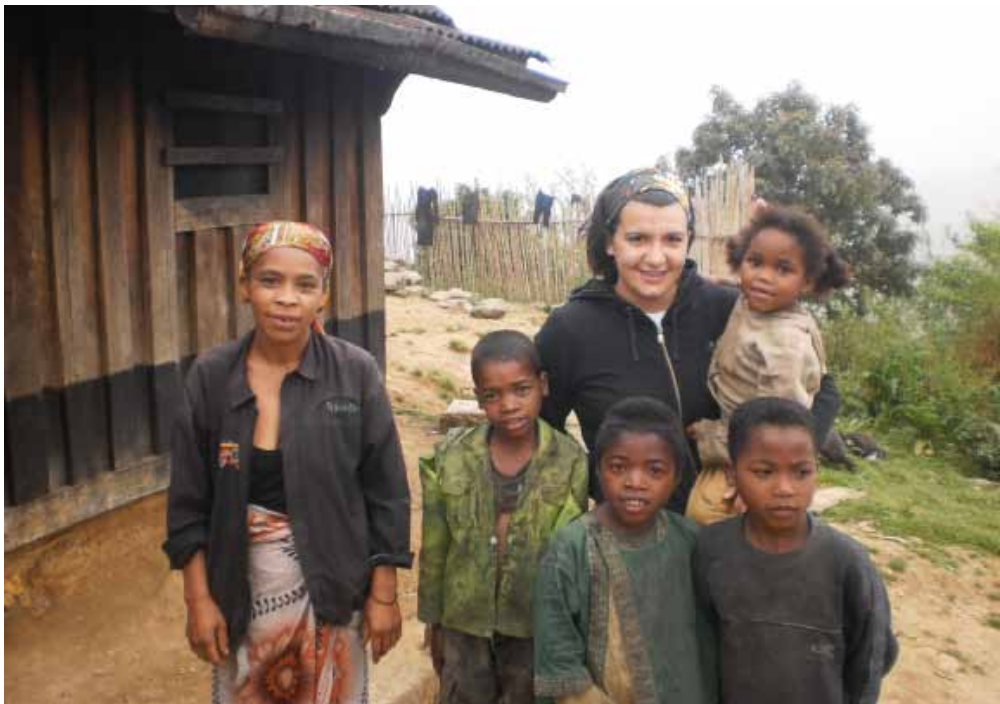
Coi bambini al villaggio degli Zafimaniry