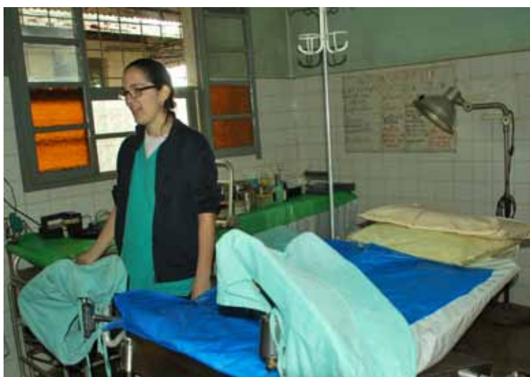
Nella sala parto dell'ospedale di Ampasimanjeva

sono ritrovata a fare è stata abituarci ad avere un approccio un po' più umile con la vita...ed è senz'altro ancora tanto il lavoro che devo fare da questo punto di vista! Eh già, ho visto tanti bambini nascere, tante donne partorire e riprendere la strada di casa piene di forze...ma ho visto anche donne arrivare in ospedale dopo aver tentato a lungo di partorire nel loro villaggio, affidandosi alle mani di alcune signore del posto: donne allo stremo delle forze e dalle quali, una volta arrivate in ospedale, sono nati bambini decisamente sofferenti e, in qualche caso, ormai privi di vita... E questi sono soltanto alcuni esempi di quello che ho visto e vedo: ma tanti altri sono i casi e i contesti nei quali si deve accettare di "avere fatto tutto il possibile" o che "ormai non ci sia più nulla da fare"... Sono tante le domande che sorgono in momenti come questi: viene davvero da interrogarsi sulla fragilità della vita, su quanto sia appesa a un filo e, soprattutto, su come noi, nel nostro mon-